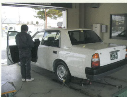
タクシーメーター